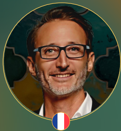
DR DE PAPÉ